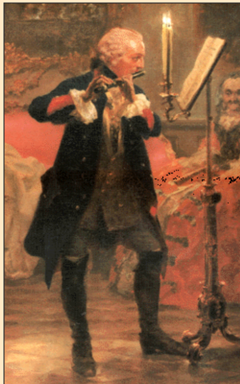
“Das Flötenkonzert Friedrichs des Großen in Sanssouci” (Adolph Menzel, Öl auf Leinwand, 1852, Detail)